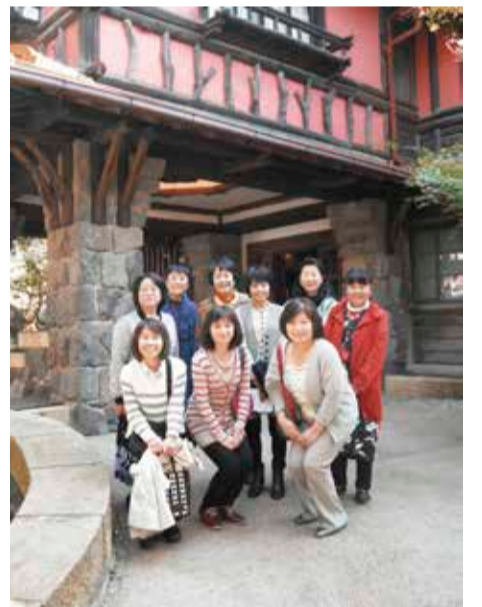
聴松閣前にてハイポーズ