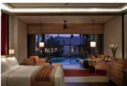
上:リゾート全体(イメージ) 下:客室(ザ・サワガンラグーン アクセスジュニアスイート)

ジャパニーズバーやインドネシア料理レストラン、ビーチフロントのシーフードグリルなど、各種レストランも充実。ジムやスパ、プールもお楽しみいただけます。見事に自然との調和を保つこのリゾートで、リッツ・カールトンのおもてなしを存分に堪能ください。