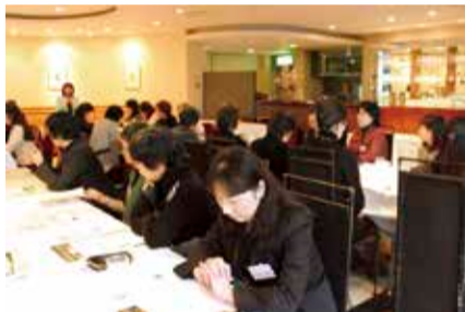
多数の会員が参加した昨年の総会