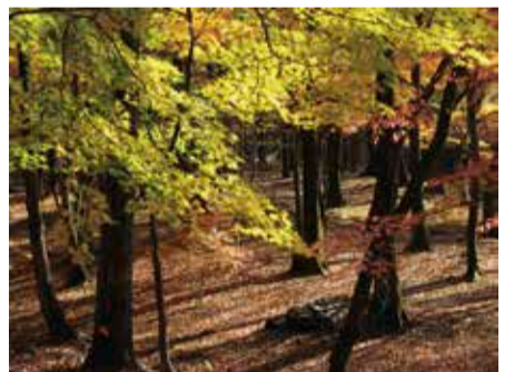
もみじ狩りと紅葉

て日本にやってきた九尾の尾をもつ狐は、絶世の美女「玉藻の前」に化けて帝をだまし悪事をはたらきました。九尾の狐は陰陽師によって見破られ、大きな石に変えられたという伝説です。殺生石には狐の化身といわれる岩が今もなお、退治された恨みを抱いて毒気を吐いているという事です。