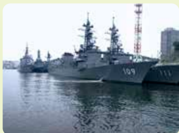
軍港めぐりのワンシーン「長浦湾の海上自衛隊護衛艦」

京急観光も今年から沿線集客部を新設し、三浦半島のPR事業に取り組んでいます。私の担当は、京急沿線にある企業やグループ施設、自然などを