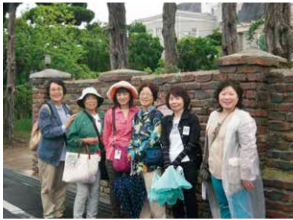
キャブ池田町洋風住宅(ヴォーリズ建築)前にて

2013年に「旅と健康ハイキング」をテーマに勉強会を開催し、2014年度はその実